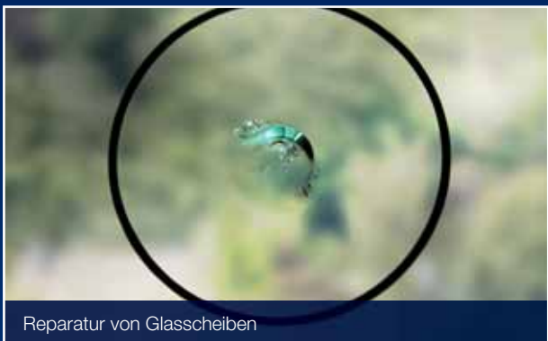
Reparatur von Glasscheiben