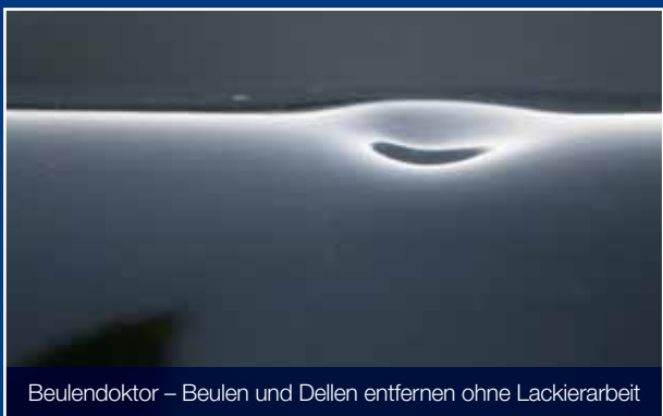
Beulendoktor – Beulen und Dellen entfernen ohne Lackierarbeit