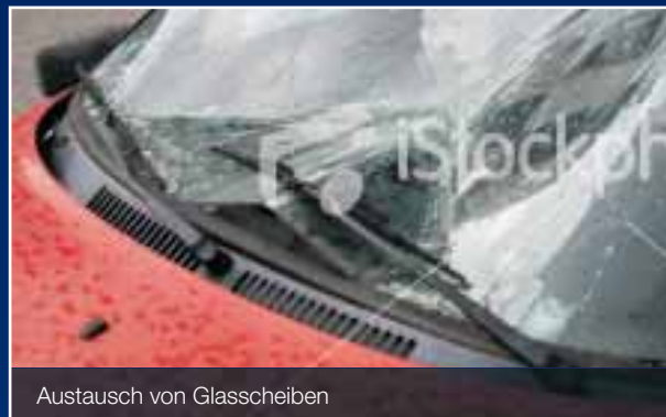
Austausch von Glasscheiben

Für ein perfektes Ergebnis setzen wir modernste hydraulische Richtanlagen, digitale Farbmessgeräte, computergesteuerte Lackmischanlagen und neuste UV- und Infrarot-Trocknungstechnologie ein. Ihre Zufriedenheit hat bei der Gebr. Heymann GmbH oberste Priorität, und das werden Sie spüren und sehen! Dellen, Beulen, Steinschlag- oder Hagelschäden im Lack oder in der Frontscheibe können nicht nur die Freude am Fahrzeug mindern, sondern auch die Verkehrssicherheit gefährden. Auch ein Brandloch im Polster trübt die Stimmung erheblich. Diesen Schönheitsfehlern rücken wir mit den modernsten Techniken zu Leibe und sorgen für ein makelloses Erscheinungsbild Ihres Fahrzeugs – innen wie außen.