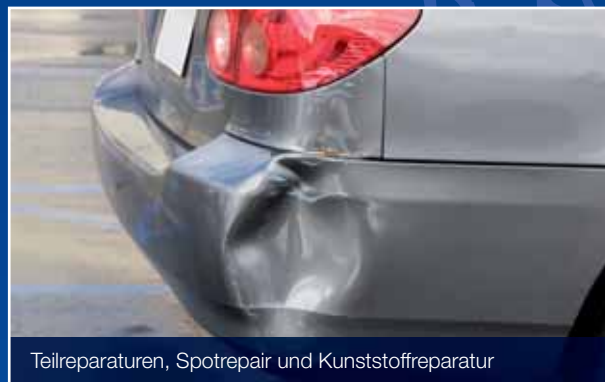
Teilreparaturen, Spotrepair und Kunststoffreparatur