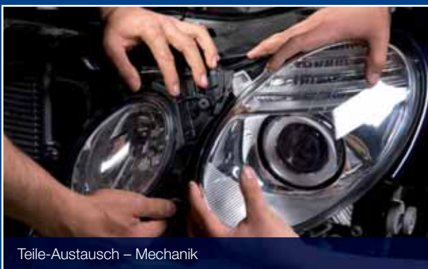
Teile-Austausch – Mechanik