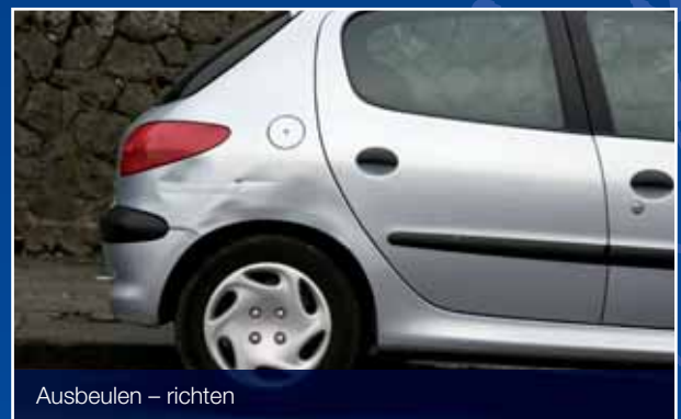
Ausbeulen – richten